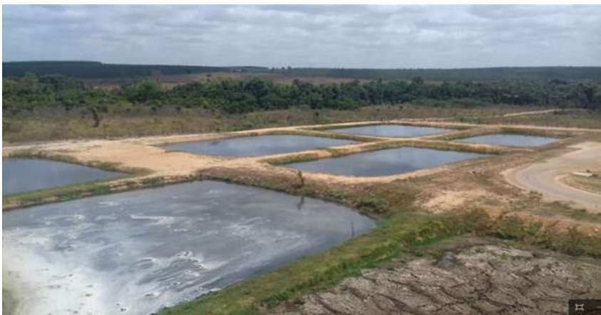
ETE - Estação de Tratamento de Efluentes